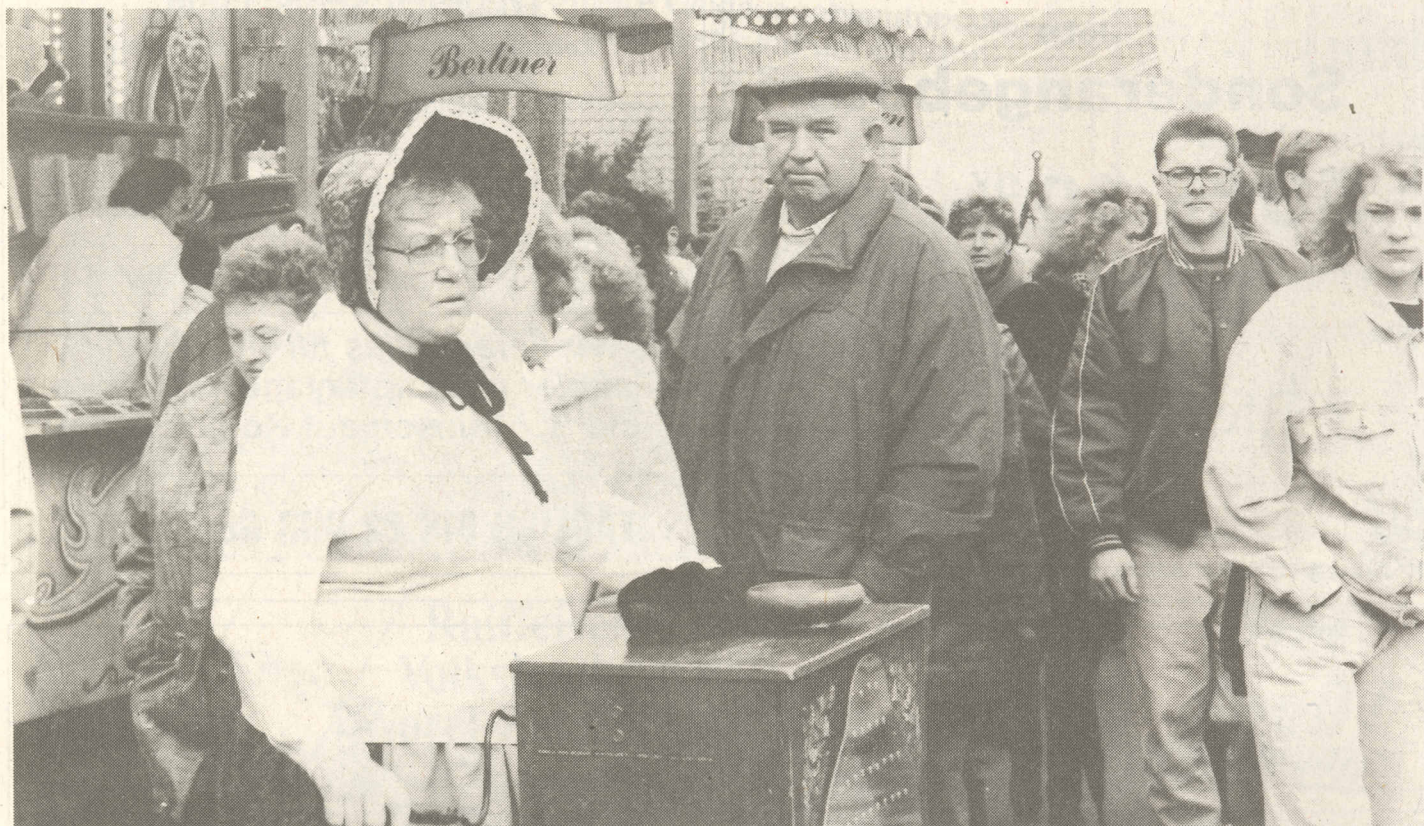
Mit Musik geht alles besser: Zünftige Orgelklänge auf dem großen Volksfest in Zetel.

Historie liegt bis heute im dunkeln – Sagen und Mythen: Marktrecht gegen ein Faß Bier